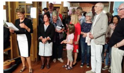
Ausstellungseröffnung 2018